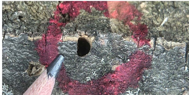
Orificio de emergencia en forma de D