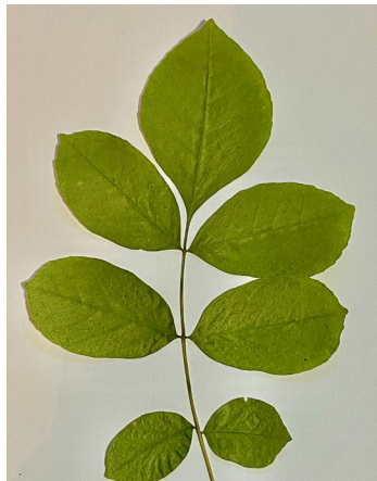
Hoja de fresno de Oregon